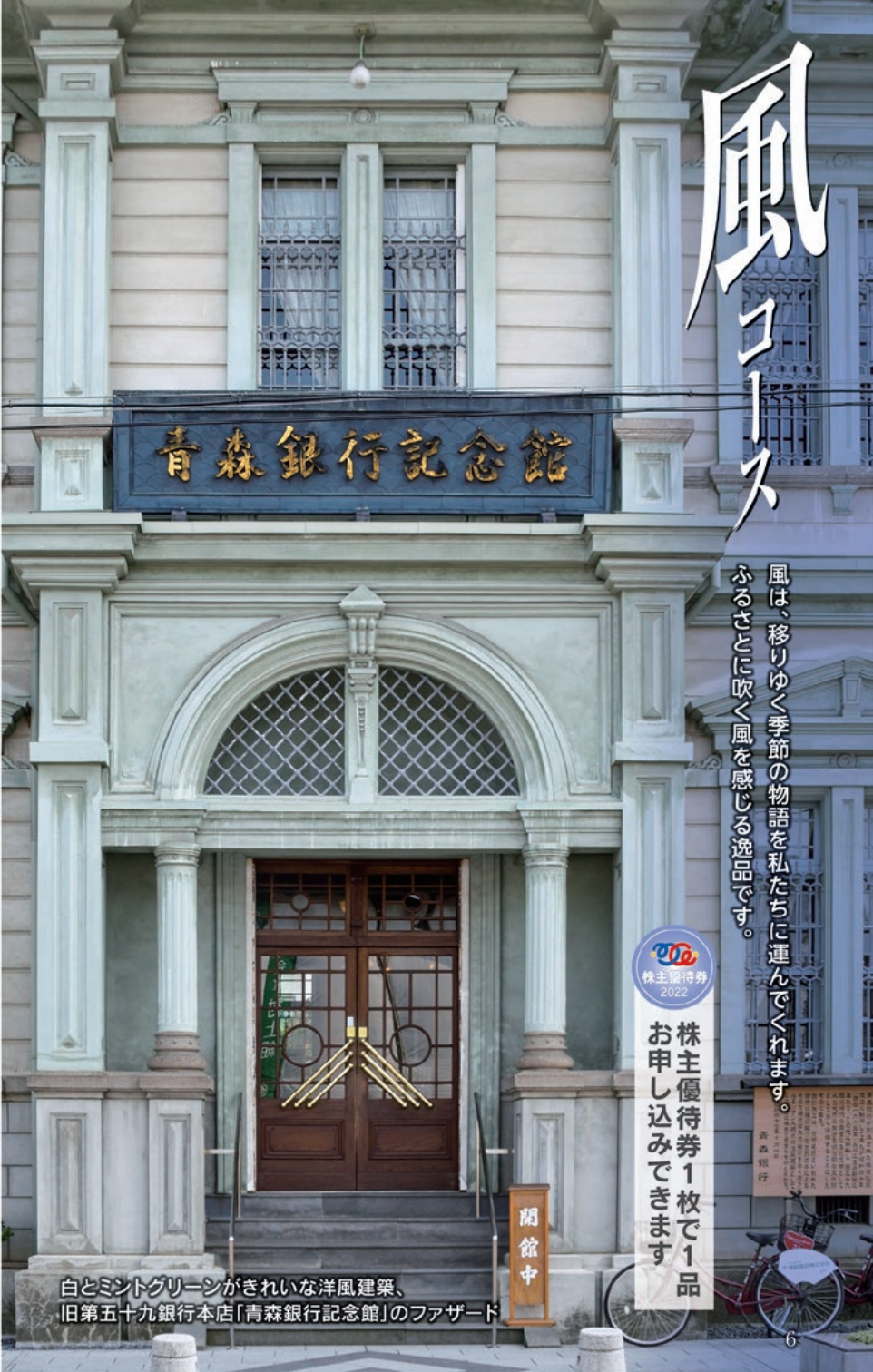
白とミントグリーンがきれいな洋風建築、旧第五十九銀行本店「青森銀行記念館」のファザード