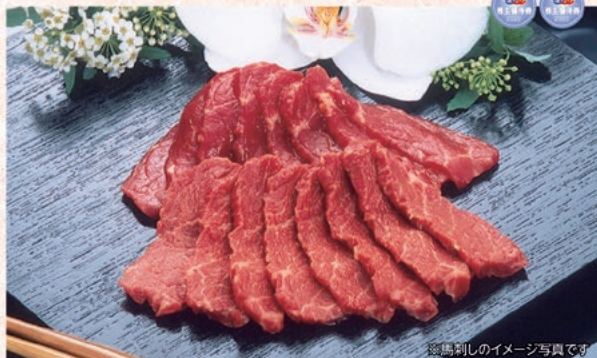
※馬刺しのイメージ写真です

馬肉は他のお肉に比べて低カロリー、低脂質、高タンパクと言われています。大人気の上馬刺セットと上焼肉セットとご用意しました。お手軽にご家庭で味わえる「桜肉の老舗尾形」の味です。