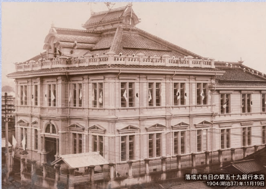
落成式当日の第五十九銀行本店 1904(明治37)年11月19日

カタログ掲載の優待品に関するお問い合わせは、 お気軽にカタログサービスセンターまでご連絡ください。 お問い合わせの際には、お申し込みハガキまたは株主さま控え欄に記載の 整理番号 をお知らせください。