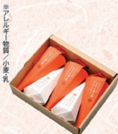
※アレルギー物質/小麦乳

内容/ビーフシチュー220g×3 ミネストローネ180g×2 賞味期限/製造日より2年