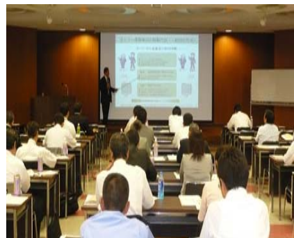
●事業承継セミナー