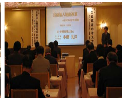
●公益法人制度改革対応セミナー