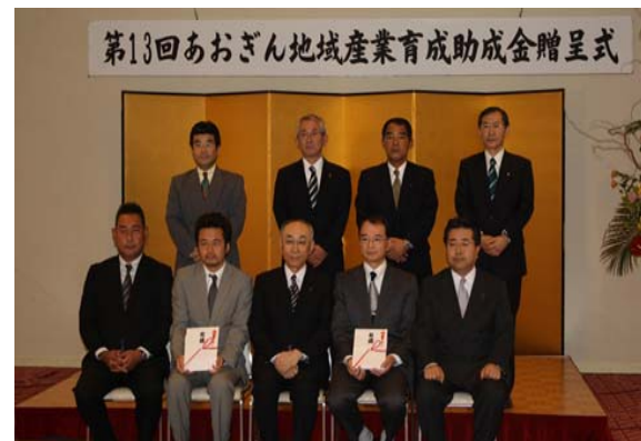
●あおぎん地域産業育成助成金贈呈式

「農商工連携型地域中小企業応援ファンド融資事業」を活用し、青森県が組成したファンドであり、総額28億円の支援基金によりスタートいたしました。21年度の助成実績は、8先、13.8百万円となっており、当行も同ファンドを通じた、農商工連携に向けた取組みを強化しております。